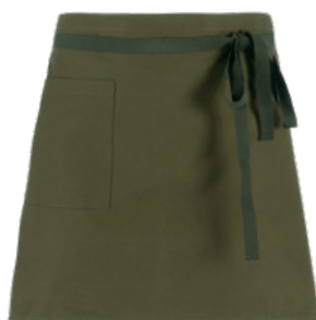
Z43 Military green